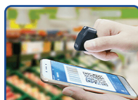
商超零售-结账付款