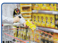
电商零售-语音拣选