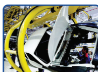
制造业-流水线作业